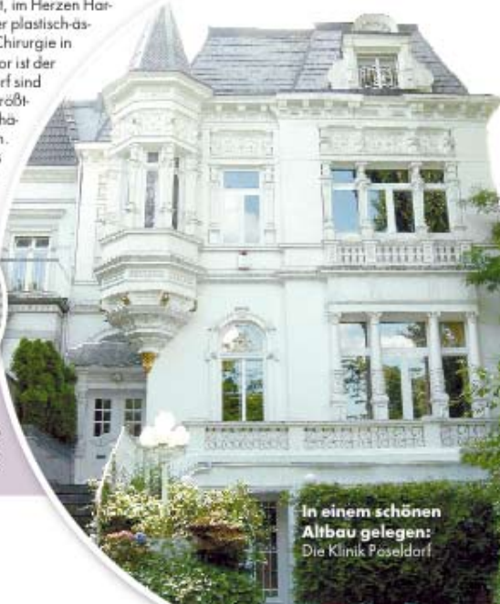
In einem schönen Altbau gelegen: Die Klinik Pöseldorf

„Pöseldorf in Harvestehude ist für mich die schönste Gegend der Stadt. Hier finde ich alles, was ich für ein perfektes Leben brauche: die Alster mit tollen Spazierwegen und wunderbarer Aussicht, gehobene Gastronomie, Einkaufsmöglichkeiten und ein unvergleichliches Ambiente.“